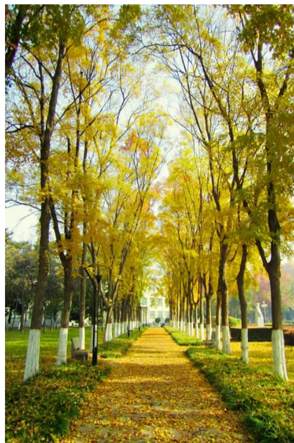
(一等奖 机电学院 索文浩《凋零的美丽》)