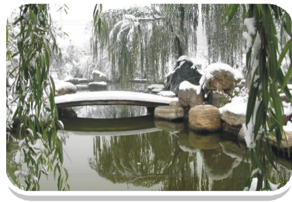
绿潮 第 58 期