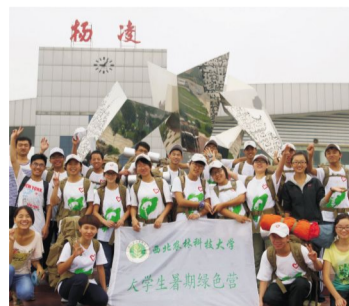
我校大学生“绿色营”开启第九次渭河考察活动