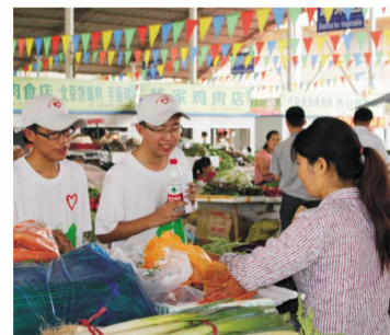
水建学院赴杨凌周边“限塑令”调查服务队走访农贸市场