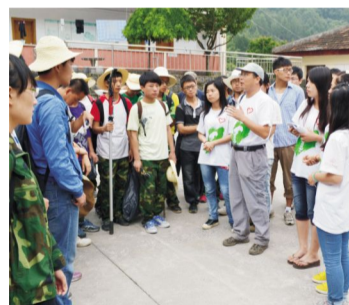
林学院赴火塘试验林场服务队向实习生开展生态文明宣讲