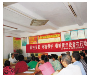
秦岭青年使者赴太白服务队举办科技讲座