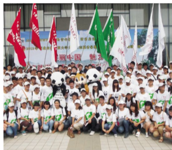
奥运冠军陈一冰与大学生志愿者暑期走进秦岭践行环保