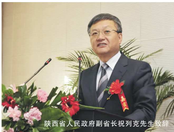
陕西省人民政府副省长祝列克先生致辞

以“现代农业：科技创新与推广”为主题的“2012' 杨凌国际农业科技论坛”11月5—7日在我校国际交流中心举行。本届论坛由教育部、国家外国专家局和陕西省人民政府主办，我校、陕西省外国专家局和杨凌农业高新技术产业示范区管委会承办。围绕主题，论坛平行举办5个专题的国际学术研讨会，来自美国、加拿大、澳大利亚、韩国等17个国家以及国内高校和科研机构的140余名专家学者参加论坛，研讨交流农业科技最新研究成果。