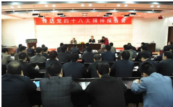
我校师生对祖国、对党的热爱，我们以饱满的精神状态迎接十八大的到来，我们以认真求实的态度贯彻十八大的精神。