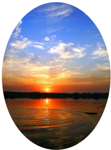
百折千回寻,蓦然回首盼。她在那里,等风来……