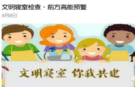
文明寝室检查·前方高能预警