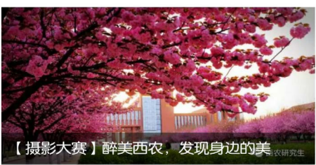
【摄影大赛】醉美西农，发现身边的美