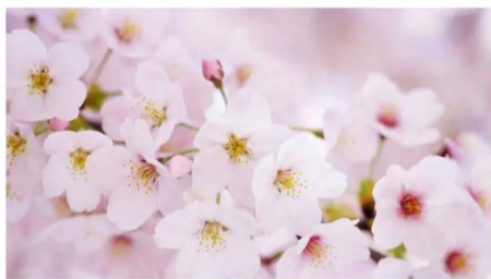
你经过我身边 像鹿穿过花岗 风吹开一树樱花 春意那么深