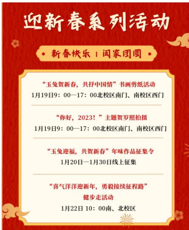
2023 寒假新春系列活动方案

部门对寒假期间留校学生“玉兔送福迎新春 乘风破浪绘新篇”新春系列活动进行了总结回望，以及财务报账。部门在寒假放假前一月开始着手进行新春活动的策划及讨论修改，大家充分发挥特长爱好优势，拟出了许多新颖可施行的新春活动，并对活动的线下、线上工作进行分工安排。虽然由于疫情原因，活动方案不断有调整变化，但最终克服重重困难圆满完成了留校学生新春活动的举办。