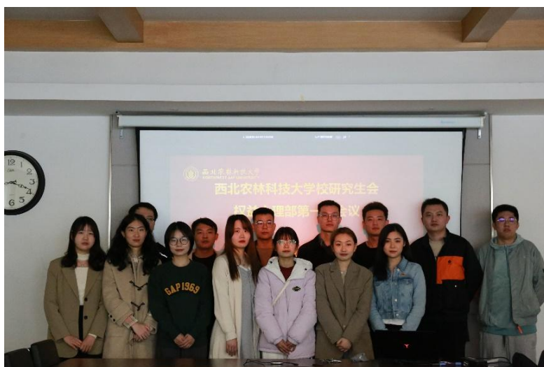
第六届研究生会权益心理部第一次工作例会

组织召开部门第一次工作例会，宣读部门负责人、工作人员职责分工，对近期待开展工作进行部署安排，对权益心理部全体成员开展相关工作技能培训，进行了主题为学习 2023 年中央一号文件的政治理论学习。