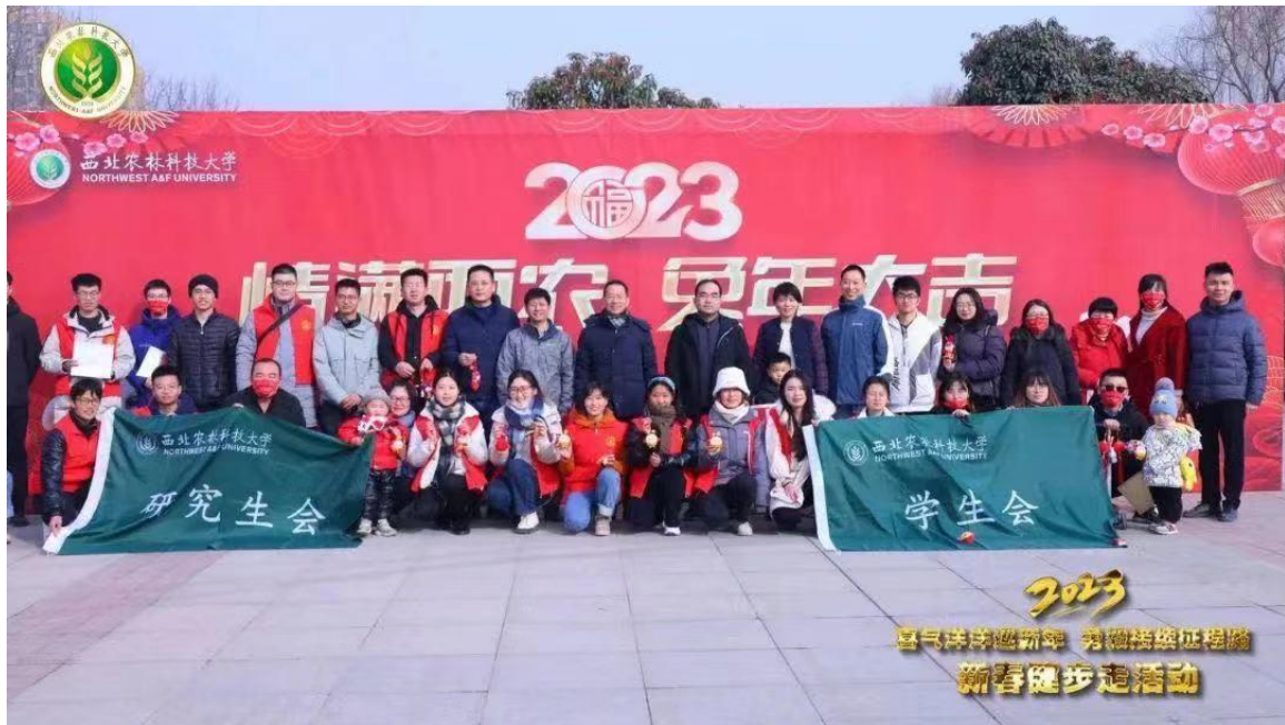
2023 寒假新春系列活动——贺岁照拍摄