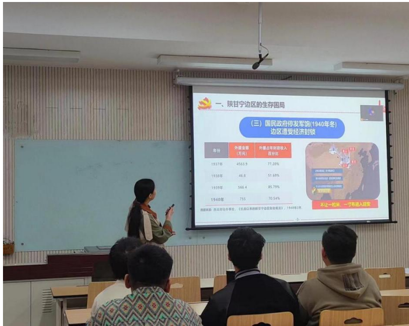
第六届研究生会文体部第一次工作例会