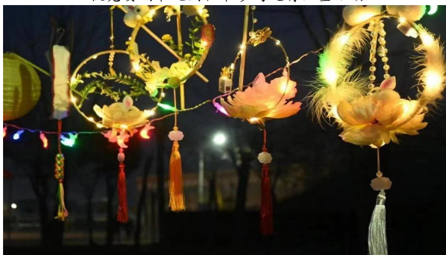
元宵灯展作品一角