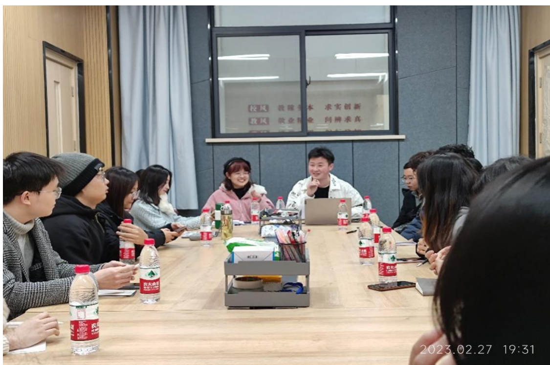
第六届研究生会学术发展部第一次工作例会

(二) 组织召开第六届研究生学术发展部第一次工作例会 组织召开部门第一次工作例会，宣读部门负责人、工作人员职责分工，对近期待开展工作进行部署安排，对学术发展部全体成员开展相关工作技能培训，学习《关于推动高校学生会（研究生会）深化改革的若干意见》与《西北农林科技大学研究生会章程》，并完成例会纪要工作。