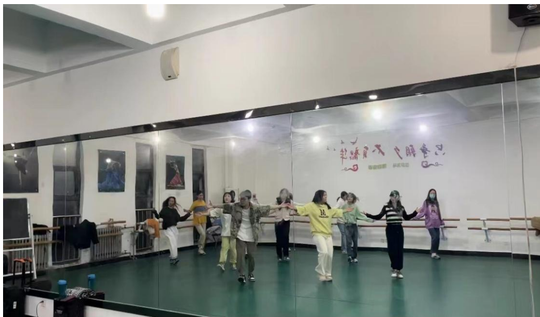
硕博舞蹈队（爵士舞队）日常训练风采