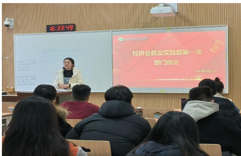
第六届研究生会就业实践部第一次工作例会

组织召开部门第一次工作例会，宣读部门负责人、工作人员职责分工，对近期待开展工作进行部署安排，学习《西北农林科技大学研究生会章程》，进行政治理论学习，并完成例会纪要工作。