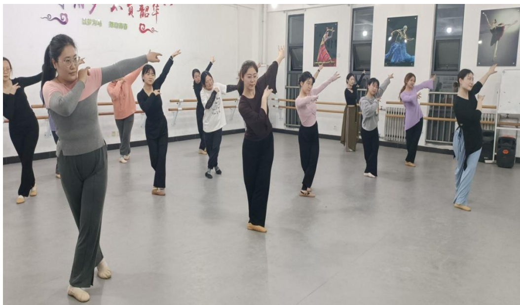
硕博舞蹈队（中国舞队）日常训练风采

组织硕博舞蹈队（下设中国舞队、爵士舞队）、合唱团日常训练，并与大学生艺术团老师沟通协调进行授课指导，为硕博展演及本学期活动比赛进行有目的性的教学和排练。