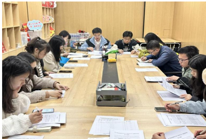
第六届研究生会办公室第一次工作例会

组织召开部门第一次工作例会，宣读部门负责人、工作人员职责分工，对近期待开展工作进行部署安排，对办公室全体成员开展相关工作技能培训，学习《关于推动高校学生会（研究生会）深化改革的若干意见》与《西北农林科技大学研究生会章程》，并完成例会纪要工作。