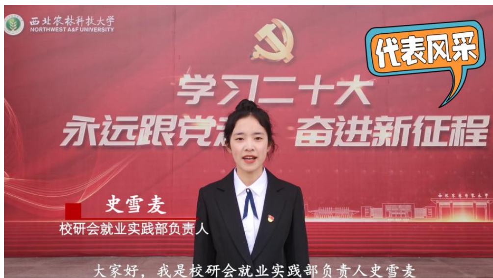
团学骨干代表风采视频示例

完成 2022-2023 学年团学骨干聘任大会前期宣传准备工作，录制团学骨干代表风采视频。